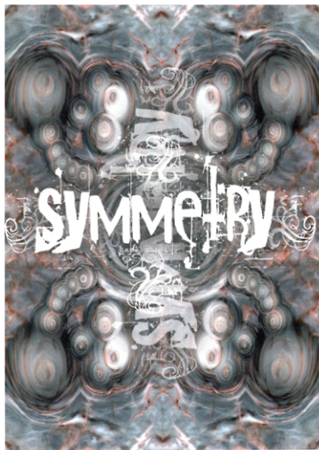
A SYMMETRIC VISION : Font par Chris Hansen.